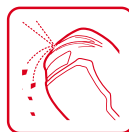
Inserto anti- detriti